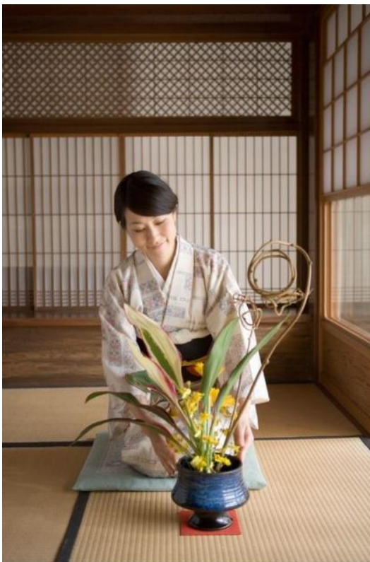
ყვავილების არანჟირება მიჩნეულია შემოქმედებით მიღწევად, რომლითაც ადამიანი თავისუფალ დროს არის დაკავებული.

რომელიც გაავსებდა საგამოფენო დარბაზებს. მრავალრიცხოვან თანამედროვე სახეობებთან ერთად, იკებანა აგრძელებს ტრადიციული ფორმების შესწავლას და განვითარებას. იკებანა, რომელიც ასევე ცნობილია სახელით კადო, რაც ნიშნავს ყვავილების გზას, ასევე გამოიყენება მედიტაციის საშუალებად სხვადასხვა დროის, სეზონისა თუ ცვლილებების გარდამავალ ეტაპზე. მისი რელიგიური წარმომავლობა და ძლიერი კავშირი ბუნებრივ ციკლთან, როგორცაა დაბადება, გაზრდა, დაბერება, ხელახლად მოვლინება და ა.შ., იკებანას ღრმა სულიერ რეზონანსს ანიჭებს.